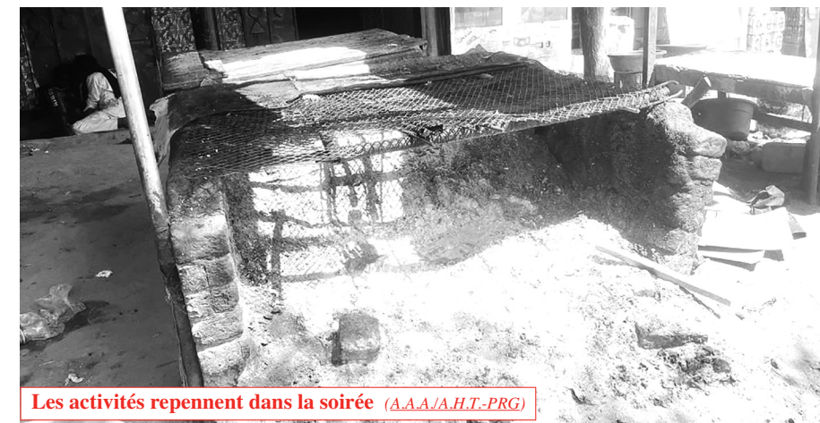
Les activités reprennent dans la soirée (A.A.A.J.A.H.T.-PRG)

Aux environs de 21h 30, ce mercredi 25 février 2026, dans la commune du 4 ème arrondissement de N'Djaména, l'alimentation Arihab vit son moment de pointe. L'ambiance est calme mais animée, avec des clients confortablement installés sur des chaises, attendant leurs sandwiches aux œufs ou à la viande. D'autres chaises