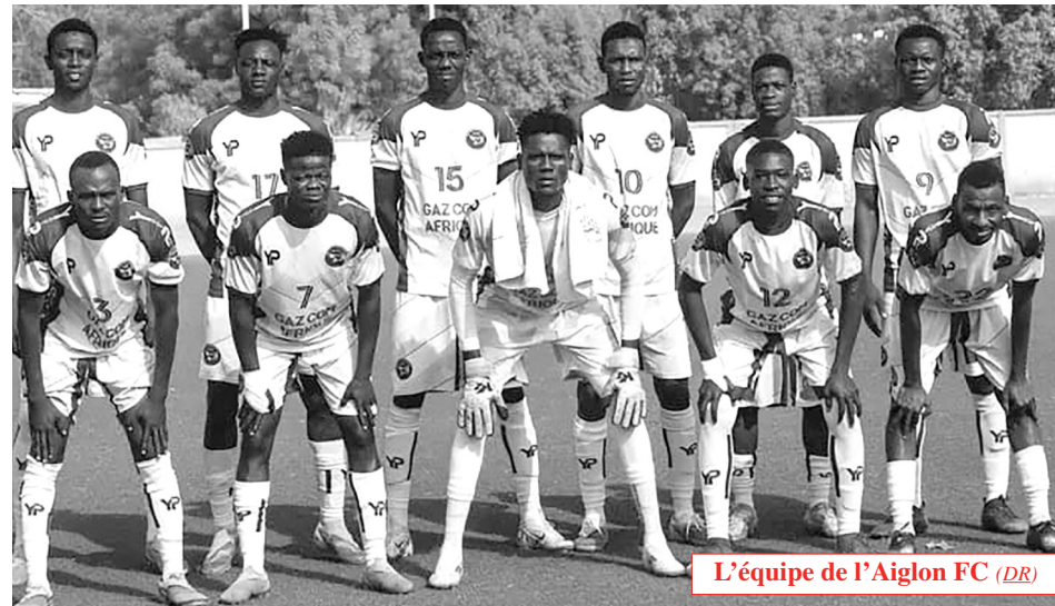
L'équipe de l'Aiglon FC

La course au titre du championnat national de football du Tchad saison 2025-2026 continue de tenir toutes ses promesses. La 10 ème journée clôturée, ce dimanche 22 février 2026, a offert son lot de surprises et de confirmations avec cinq rencontres disputées sur six initialement prévues. La 11 ème journée débutera, ce dimanche 1 er mars 2026, avec des affiches prometteuses. Eléphant FC d'Am-Timan affrontera Elan Derby de Pala. AS-PSI de N'Djaména jouera contre Espoir FC de Bongor. Scorpion FC de Borkou rencontrera Tout puissant Elect Sport de la capitale. Aiglon FC de Hadjer Lamis se mesurera à AS Santé d'Abéché. UDM de Moundou ira défier son voisin, ONAPE FC de Doba. Aiglon FC de N'Djaména jouera contre Foullah Edifice de Moussoro.