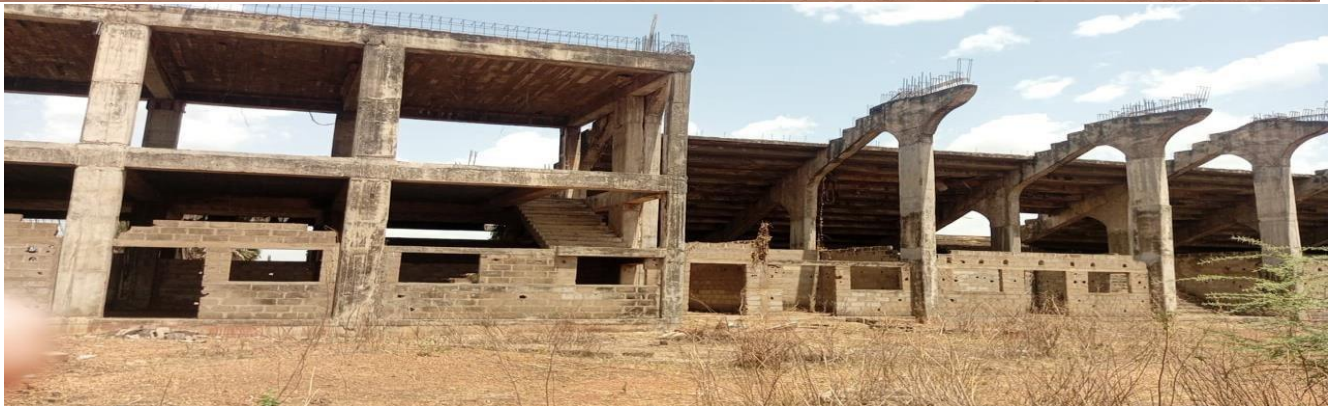
Vue de face tribune officielle