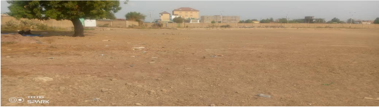
Tribune latérale gauche