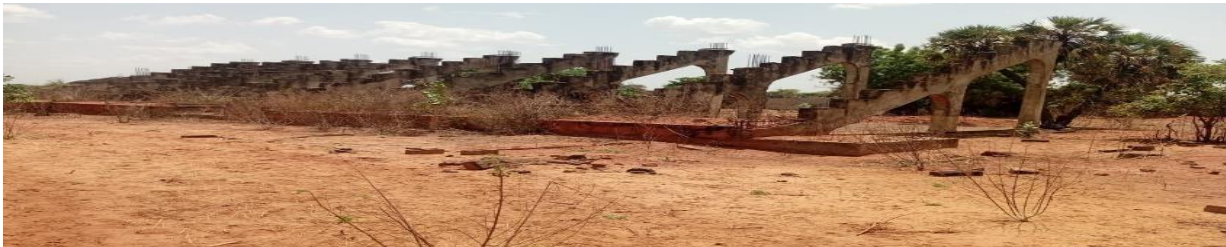
Entrée principale du stade