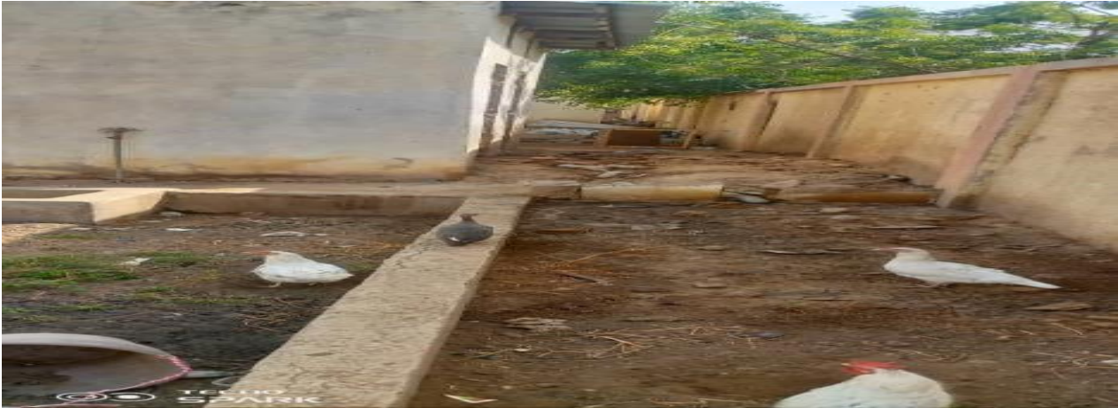
Tribune latérale gauche