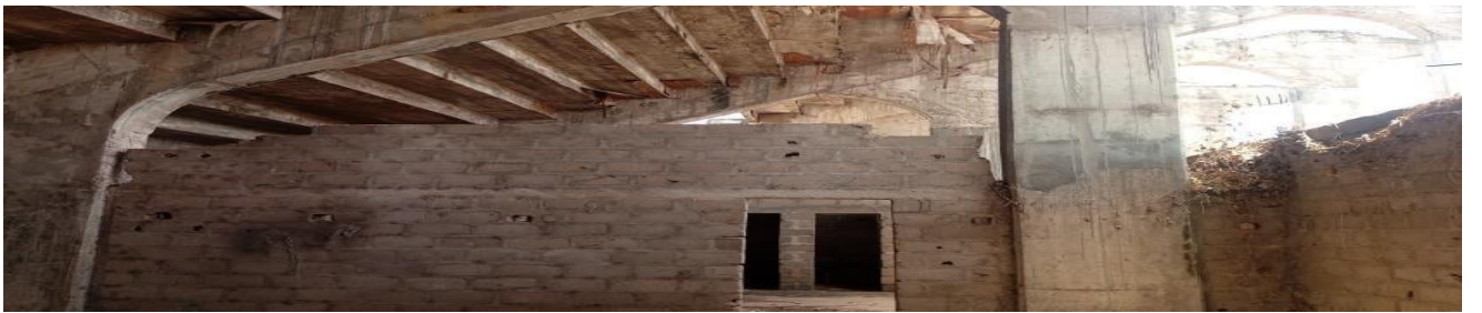
Salle d'attente VIP