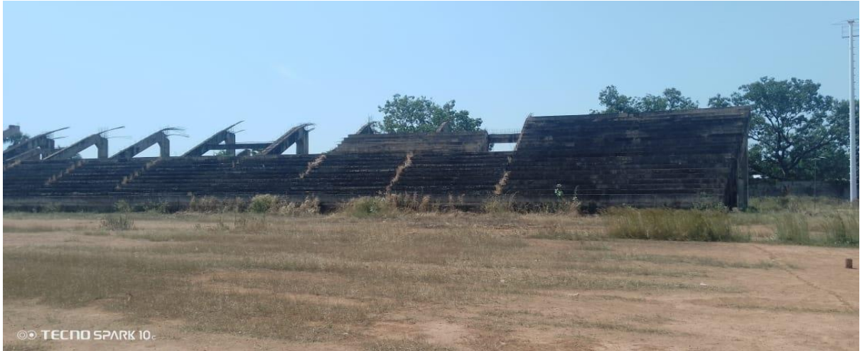
Vue de profil tribune galaxie