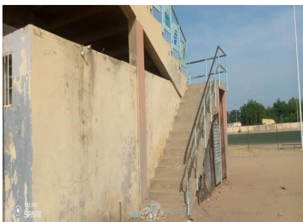
Escalier de la tribune latérale