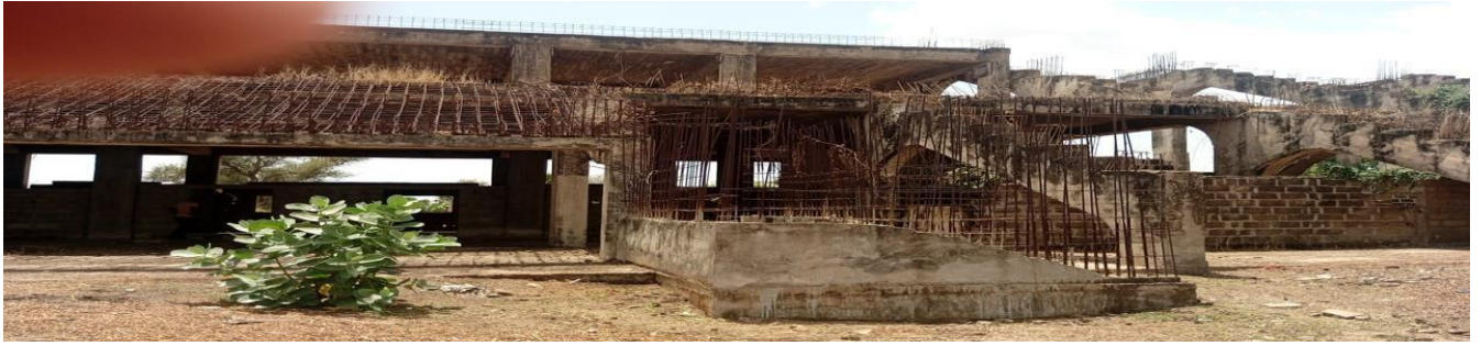
Vue arrière de la tribune latérale