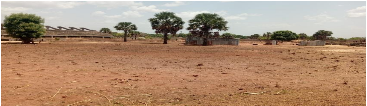
Vue de face tribune latérale