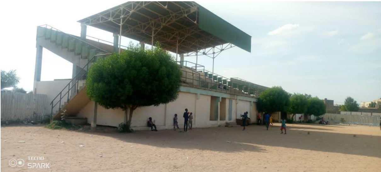
Terrain de Football