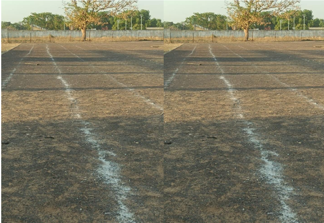
La piste d'athlétisme