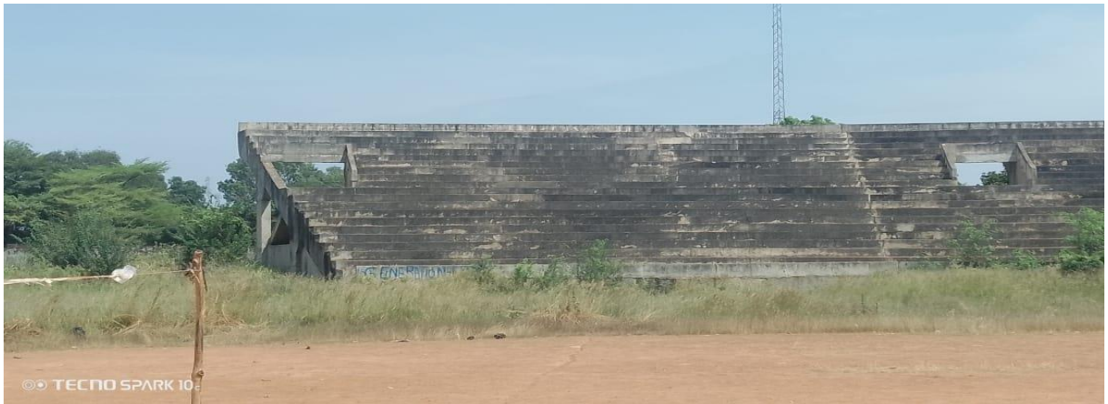
Vue de dos tribune officielle et latéraux