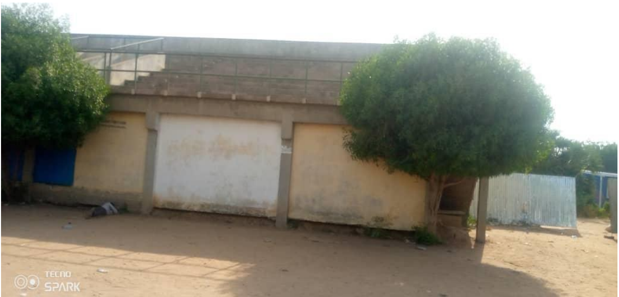
Espace de jeu