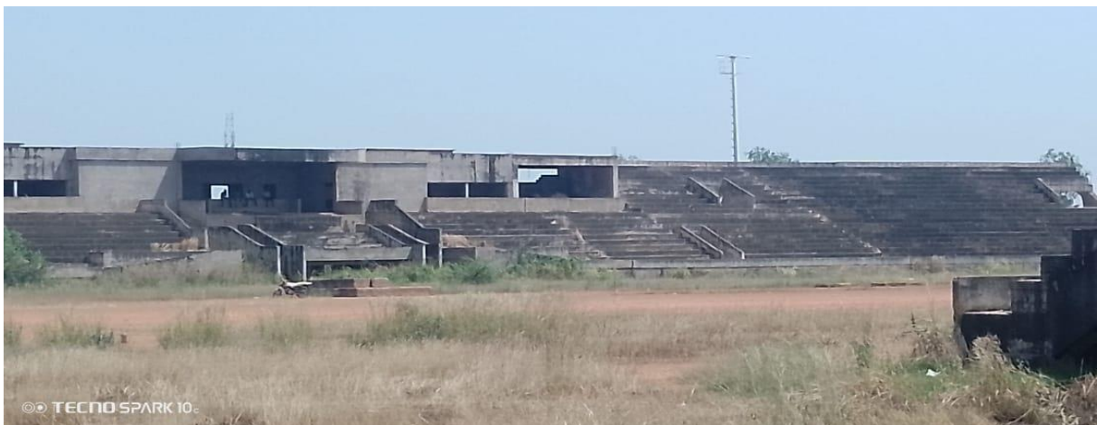
Vue de face tribune Officielle et latéraux

L'entreprise ENCOBAT a remporté le marché de construction du Stade de la Paix de Moundou en 2009. Elle a débuté les travaux par l'édification des murs de clôture et d'une partie des tribunes (officielle, latérales et galaxie), ainsi que des gradins pour les installations multisports. Après trois ans d'activité partielle, l'entreprise a abandonné le chantier sans préavis ni explication, ne laissant aucun gardien sur place. Le taux d'avancement des travaux est estimé à 45%.