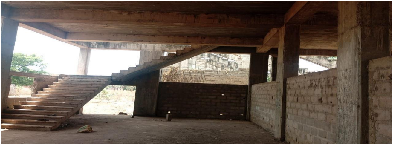
Salle d'attente des joueurs