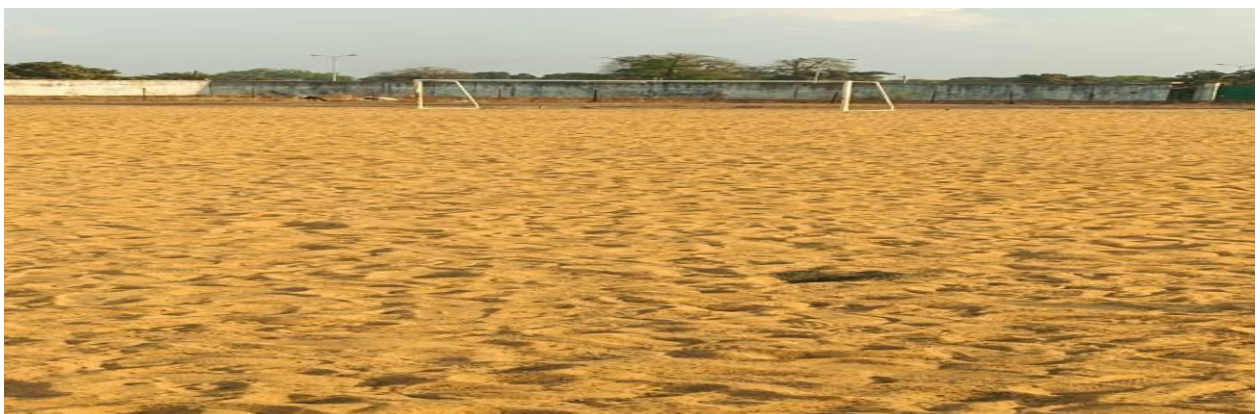
Terrain de football