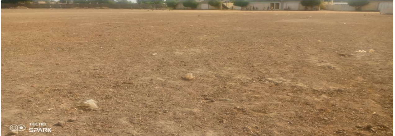
Plateau de Handball et volleyball