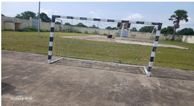
Plateau de volleyball