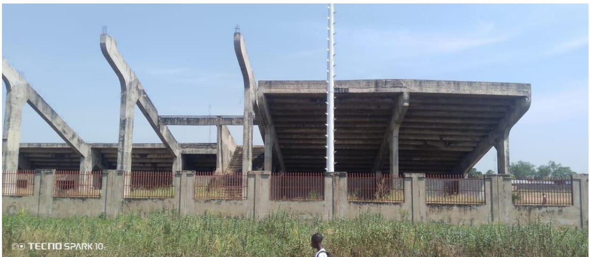
Vue de face tribune galaxie