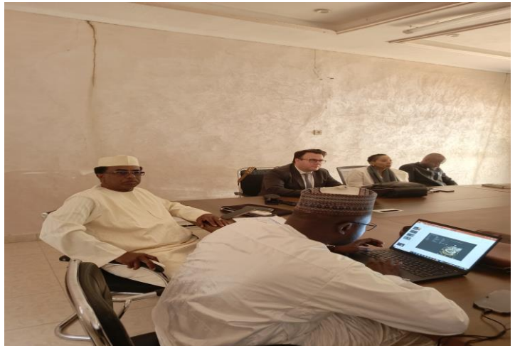
Présentation du DG du FSE