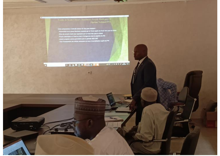
Présentation du Point Focal National du FVC-AND