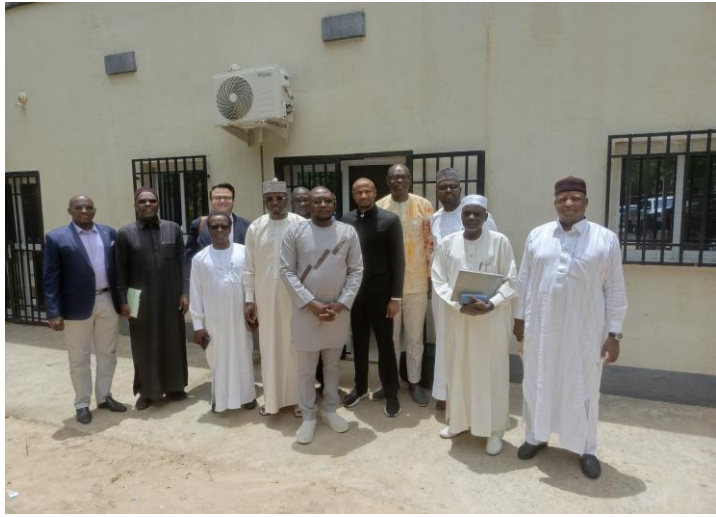
Photo de famille, à l'issue de la mission