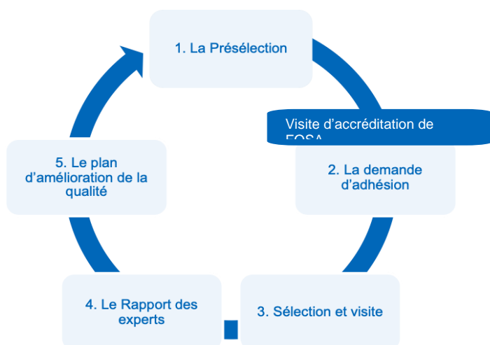
Figure 2 : Illustration des étapes d'accréditation des FOSA

Pour le processus d'accréditation des FOSA (publics et privés), les étapes sont définies ainsi qui suit ☺ ( prévoir une étape pour les recours éventuels des FOSA)